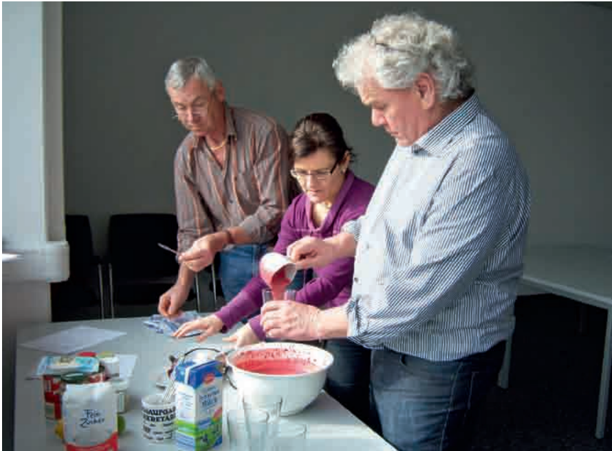
... und Schnupper-Kochkurs am Gesundheitstag