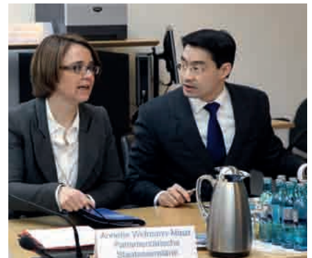
Die Parlamentarische Staatssekretärin Annette Widmann-Mauz und Bundesgesundheitsminister Dr. Philipp Rösler beim Pflege-Dialog, Februar 2011