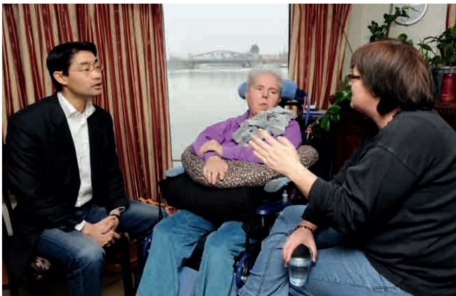
Im Gespräch über den Pflegealltag von Mutter und Tochter: Bundesgesundheitsminister Dr. Philipp Rösler begleitet einen mobilen Pflegedienst in Berlin, Februar 2011

Das Bundesgesundheitsministerium setzt den Pflege-Dialog weiter fort. Im März 2011 gab es ein weiteres Treffen zum Thema Entbürokratisierung. Weiterer Themenschwerpunkt ist die Versorgung Demenzkranker. Die Ergebnisse der Gespräche sollen in die Diskussion um das Reformgesetz einfließen, das noch in diesem Jahr im Bundesgesundheitsministerium erarbeitet werden soll. ■