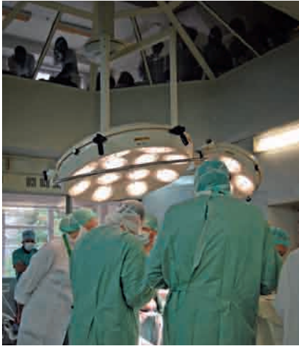
Die erste Kraniosynosthose-Operation in der Republik Moldau am 4. Oktober 2010