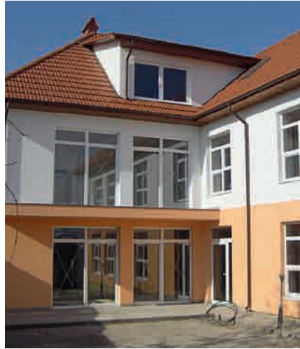
Im Bau: Tagesstätte für Kinder und Jugendliche mit geistiger Behinderung in Stauceni

„Das Engagement und die Hingabe, mit der sich die Projektbeteiligten vor Ort um eine bessere Versorgung der Kinder kümmern, sind vorbildhaft.“