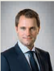
Daniel Bahr, Parlamentarischer Staatssekretär

Immer weniger Jugendliche in Deutschland rauchen – das ist das Ergebnis einer aktuellen repräsentativen Studie der Bundeszentrale für gesundheitliche Aufklärung (BZgA). Der Anteil der rauchenden Jugendlichen im Alter von 12 bis 17 Jahren hat sich von 28 Prozent (2001) auf heute 13 Prozent mehr als halbiert. Auch der Anteil junger Erwachsener zwischen 18 und 25 Jahren ist mit 38 Prozent Rauchern deutlich geringer als noch 2008 (43 Prozent). Fast zwei Drittel der minderjährigen Jugendlichen gaben laut BZgA an, noch nie in ihrem Leben geraucht zu haben. „Der weitere Rückgang des Rauchens bei Jugendlichen zeigt, dass es langfristig gelungen ist, Kinder und Jugendliche mit den Tabakpräventionsmaßnahmen zu errei-