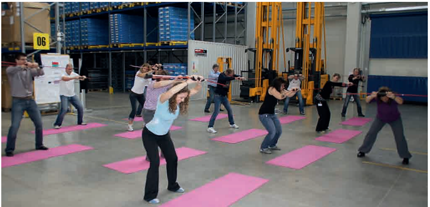
Gezielte Gesundheitsförderung im Nersinger Hilti-Werk: Swing-Stick-Training in der Logistikhalle ...